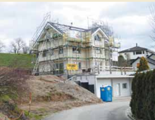
Trottenweg © 2021 Monika Meier