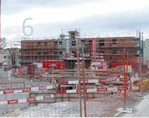
Querstrasse - Dürrestrasse