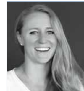
© 2021 Heinz Vögeli, Katy Wenger