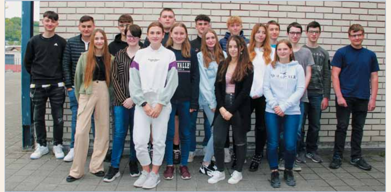
&gt; 3. Sek.