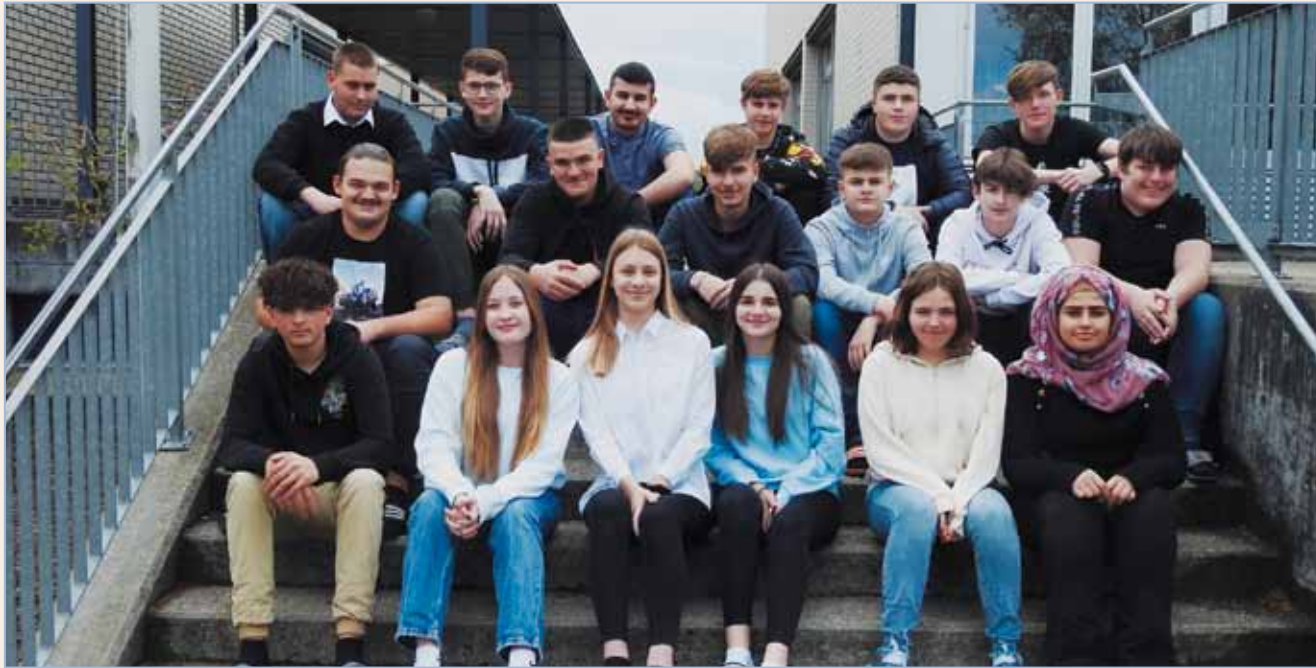
&gt; 3. Real © 2021 Schulen Böttstein