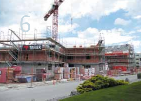
Querstrasse - Dürrestrasse © 2021 Monika Meier