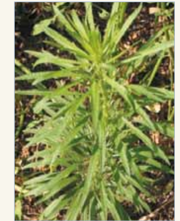
> Kanadisches Berufkraut mit und ohne Blüte