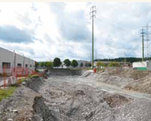
Gewerbestrasse