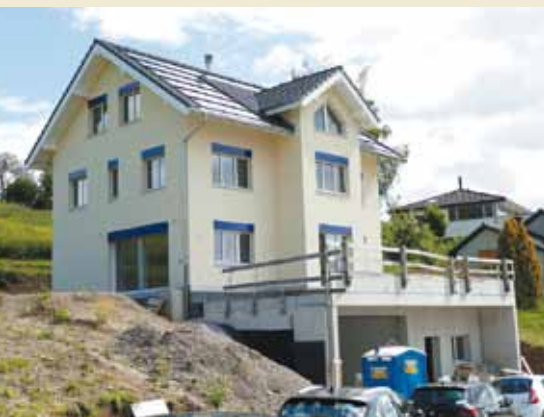
Trottenweg © 2021 Monika Meier