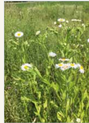
> Einjähriges Berufkraut mit und ohne Blüte

Der Pilzkontrolleur der regionalen Pilzkontrollstelle Aaretal-Surbtal, Thomas Graber, Böttstein, kontrolliert die Pilze im Restaurant Burestübli in Böttstein. Es empfiehlt sich, Pilze stets vor dem Genuss kontrollieren zu lassen.